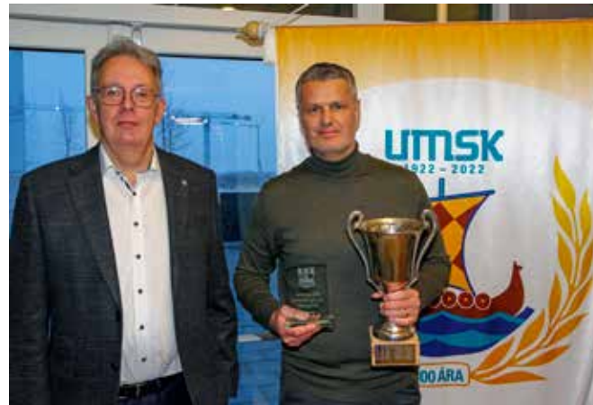
Íþróttalið ársins - Mfl. karla í knattspyrnu, Breiðablik.