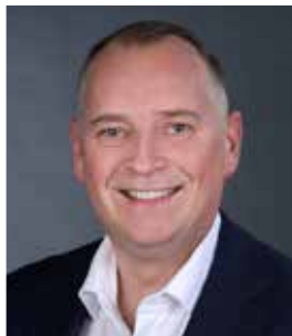
Varaformaður: Lárus B. Lárusson.