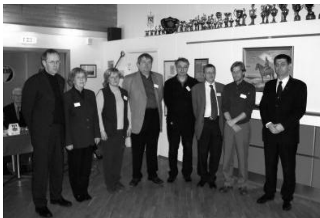
Starfsmerkishafar á 79. ársþingi ásamt formanni UMSK

Að lokum þakkaði formaður það traust sem honum var sýnt og þakkaði fulltrúum fyrir gott og málefnalegt þing.