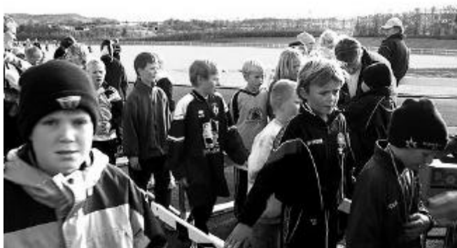
Hressir krakkar í skólahlaupi