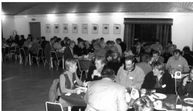
Frá síðasta ársþingi UMSK