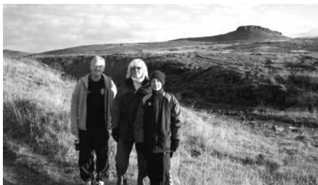
Á leið á Reykjaborg