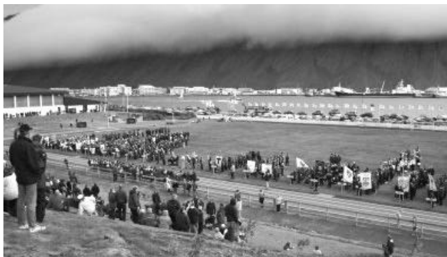
Frá setningu Unglíngalandsmóts